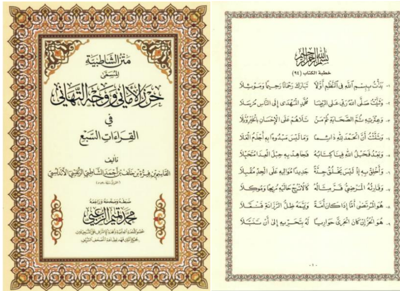
Gambar 1: Contoh matan al-Syātibiyyah cetakan Dar al-Ghauthāni tahun 2010 Masihi yang disunting oleh Syeikh Muhammad Tamīm al-Zu'bi.

dan huraian yang mudah difahami melainkan ianya adalah ringkasan-ringkasan yang disusun semata-mata untuk memudahkan para penuntut dalam menghafaz dan mengingatnya.